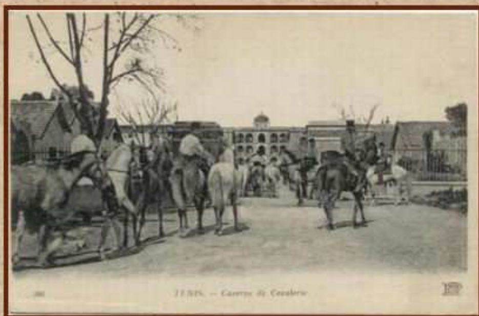
1919. — Courne de Cazabon