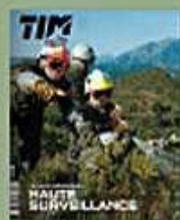
Terre Info Magazine