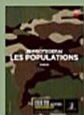
Recrutement de l'armée de Terre