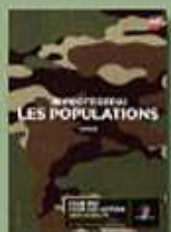
Recrutement de l'armée de Terre