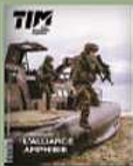
Terre Info Magazine