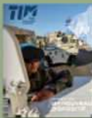
Terre Info Magazine