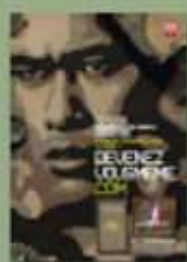
Recrutement de l'armée de Terre