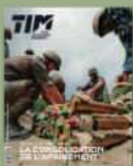
Terre Info Magazine