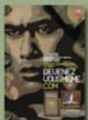
Recrutement de l'armée de Terre