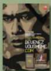
Recrutement de l'armée de Terre