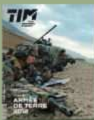
Terre Info Magazine