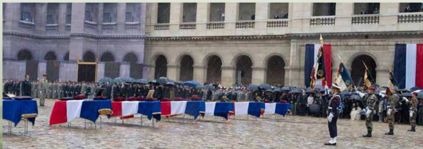
Le 18 juillet 2011 à l'hôtel national des Invalides - cérémonie d'hommage national aux soldats morts pour la France