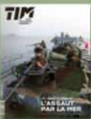
Terre Info Magazine