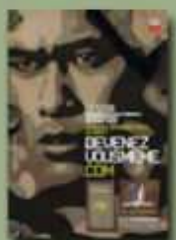
Recrutement de l'armée de Terre