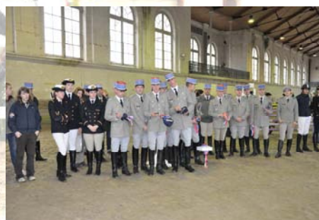
Remise des prix par équipes